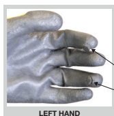
Magnets on index and ring finger